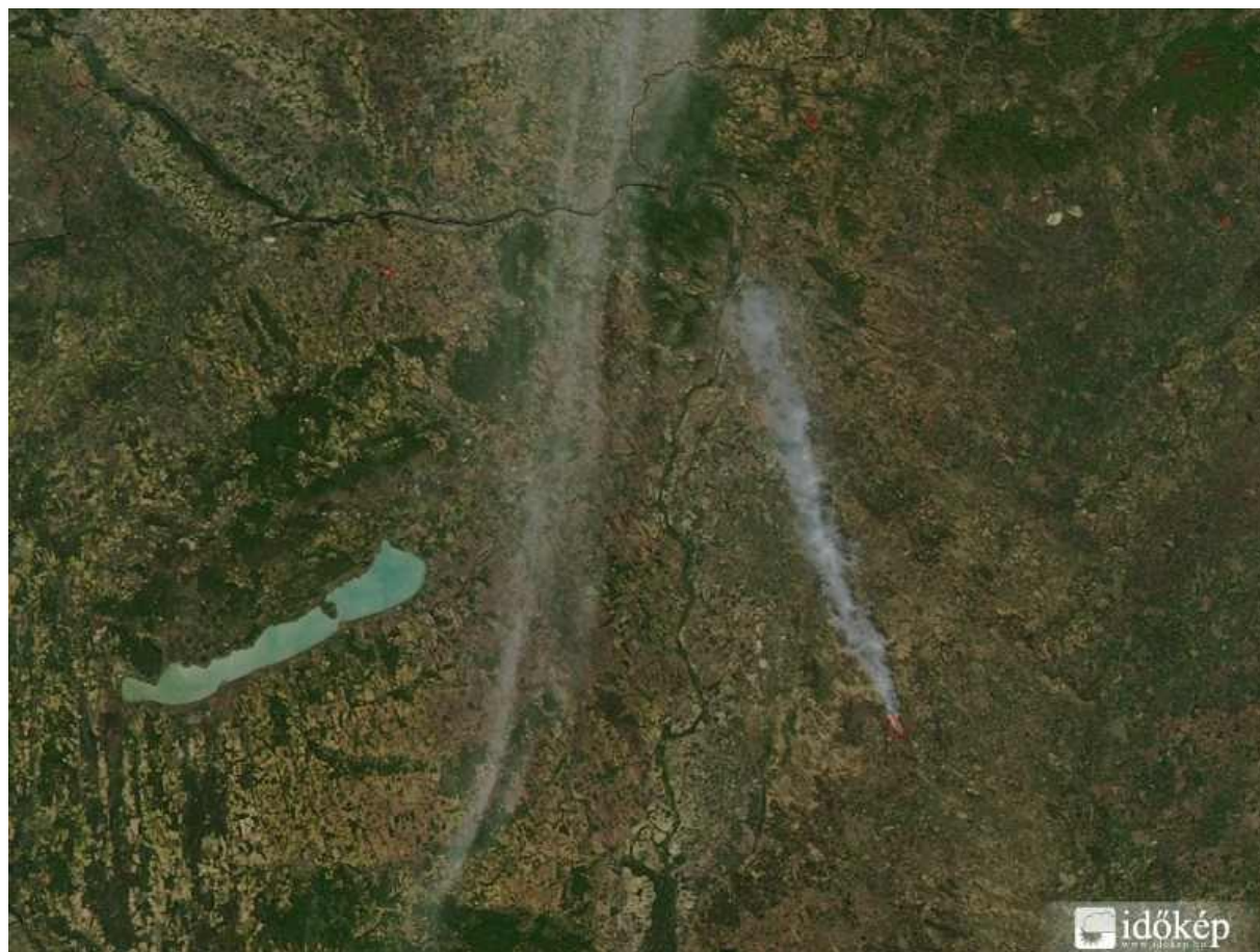
A NASA MODIS-rendszer fotója 2012. április 29-én délután készült, a bugaci erdőtűz füstje jól látható rajta.

és az erdészeti, természeti károk 11 jelentősek. A mezőgazdasági égetések közvetlen haláleseteket is előidéznek. 12