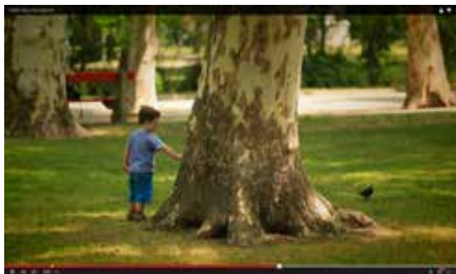
Kampányvideót készítettünk a Városligetért

Több alkalommal tettünk javaslatokat a FINA 2021. évi Úszó Világbajnokság megrendezéséhez szükséges létesítmény-fej-