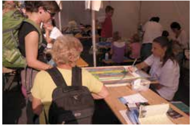
Az autómentes napon, a gépjármű-forgalom előtt lezárt Andrassy úton sátrunknál nagy érdeklődést keltett a környezetbarát közlekedést tervező játék

Sokat foglalkoztunk a robbanómotorok levegőmérgezésével a hírlevelünkben és a honlapunkon a Volkswagen botrány kipatantása után. Leveleket írtunk minisztereknek, európai parlamenti képviselőknek, a Nemzeti Közlekedési Hatóságnak a gépkocsik használat közbeni ellenőrzéséről. Ezt az ellenőrzést már a PM10-kibocsátás csökkentéséről 2001-ben hozott kormányhatározat is szorgalmazta, de eddig érdemben semmi sem történt.