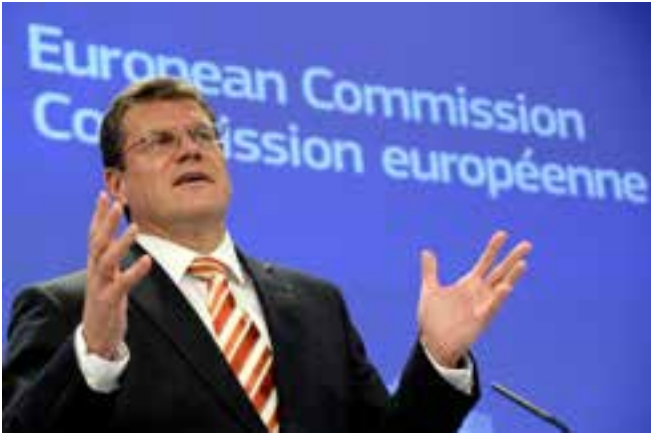
Találkozón vettünk részt Maroš Šefčovičsal, az Európai Bizottság Energiaunióért felelős alelnökével

ki Paks II környezeti hatástanulmányáról és a Pakson megtartott közmeghallgatásról.