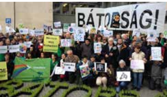
Kiálltunk a Kishantosi Vidékfejlesztési Központ mellett, többek között részt vettünk a Pesti Központi Kerületi Bíróság épületénél szervezett demonstráción

Levelet írtunk Áder János köztársasági elnöknek, amelyben támogatunk éghajlatvédelmi kezdeményezését, és egyúttal kértük segítségét a részecske kibocsátás csökkentésében.