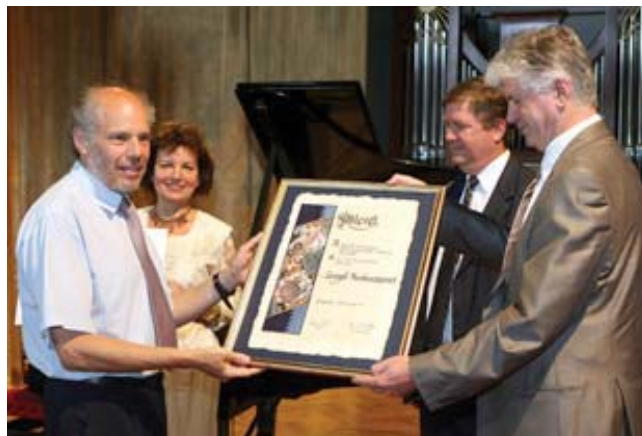
A Levegő Munkacsoport képviselői átveszik az Év Civil Szervezete díjat

Környezet- és természetvédelmi szemléletformálást, tájékoztatást végeztünk a lakosság körében, valamint országos, települési és szakmai rendezvényeken. Támogattuk a lakosságot, a civil szervezeteket, a környezetvédelmi kezdeményezéseket, az állampolgári részvételt a döntéshozatalban. Folyamatosan tartottuk a kapcsolatot a médiával a környezeti információk hatékony terjesztése érdekében.