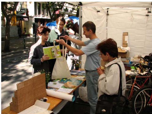
A Levegő Munkacsoport standja az Autómentes Napon