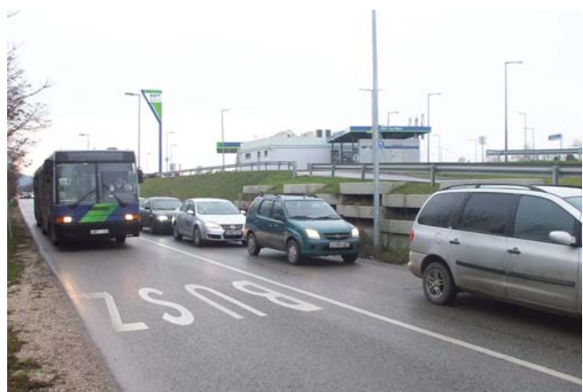
2007-ben megvalósult a Levegő Munkacsoport által már évek óta szorgalmazott buszsáv a Budaörsi úton.

Decemberben konferenciát 16 rendeztünk a parkolásról. Ennek legfőbb tanulsága az volt, hogy továbbra sincs konszenzus, rengeteg a nyitott kérdés, amely akadályozza az egységes, a „szennyező fizessen” elv alapján kialakított fővárosi parkolási gyakorlatot. Egyúttal konkrét javaslatot dol-