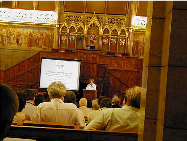
A Téségi vasutak szerepe c. konferenciát Szili Katalin házelnök nyitotta meg

nyezetvédelmi és vízügyi minisztert, hogy ígérete ellenére a 2008. évi költségvetési törvényjavaslatban és az adótörvényekben a környezetvédelem az eddigieknél is nagyobb veszteséget szenved. Jelentősen tovább növekednek az élőmunka terhei, miközben a súlyosan környezetszennyező tevékenységek támogatása, illetve adókedvezménye emelkedik.