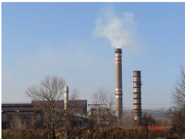
A BÉM Borsodi Érc, Ásvány- és Hulladék Hasznosító Mű

tó részére, illetve rendszeresen működünk együtt civil szervezetekkel.