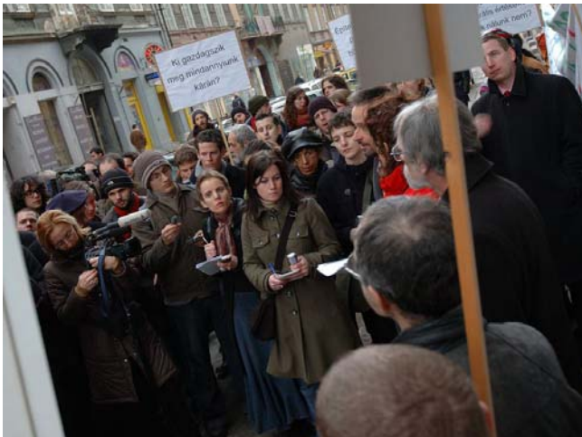
Tüntetés a Király utca 40. számú ház lebontása ellen