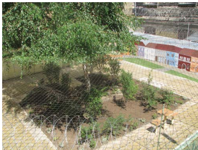
Egy büntetésvégrehajtási intézet gyógyító belső udvara

A Program az V.–VI.–VII. kerület és az Újlipótváros növényállományának növelését tűzte ki céljául. 2007 szeptemberére pályázatot írtunk ki intézmények, társasházak és civil szervezetek részére azzal a feltétellel, hogy a kiültetett növények legalább három éves ápolását is vállalják a nyertesek. Ezt a feltételt főképp csak az őrzött, zárt területek, társasházak, intézmények tudták vállalni.