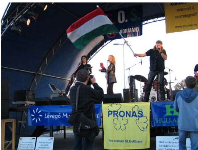
Civil rendezvény Szentgotthárdon a Rába habzása és a BEGAS a hulladékégető építése ellen

zéssel kapcsolatos eljárásrend módosítása érdekében.