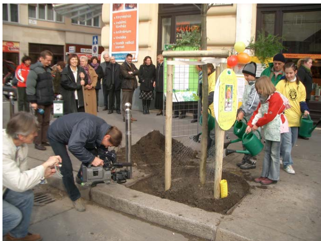
Kivágott fa pótlása a Zöld levél program keretében

goztunk ki 17 egy gyorsan és kis költséggel megvalósítható dugódíjra, amelynek bevezetésével csökkennek a dugók és a levegőszennyezés, ugyanakkor megfelelő bevétel keletkezik a BKV részére.