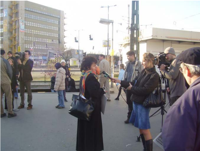
A HÉV-bérletek áremelése elleni sajtótájékoztató az Örs vezér téren

aki amiatt pereskedik és kér kártérítést, hogy a lakása az épülő M0-ás és M6-os autópálya, valamint a Metallochemia kármentesítési munkálatainak helyszíne közvetlen közelében van. Hatalmas a zaj- és porszennyezés.