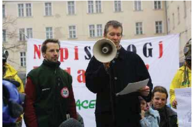
Februárban a Levegő Munkacsoport és a Greenpeace a főváros levegőminőségének javításáért tüntetett.

Szeptemberben precedens értékű per indult 15 a Levegő Munkacsoport szakmai támogatásával: egy budapesti lakos, aki a belvárosi légszennyezettség miatt lett allergiás és asztmás, egymillió forint kárté-