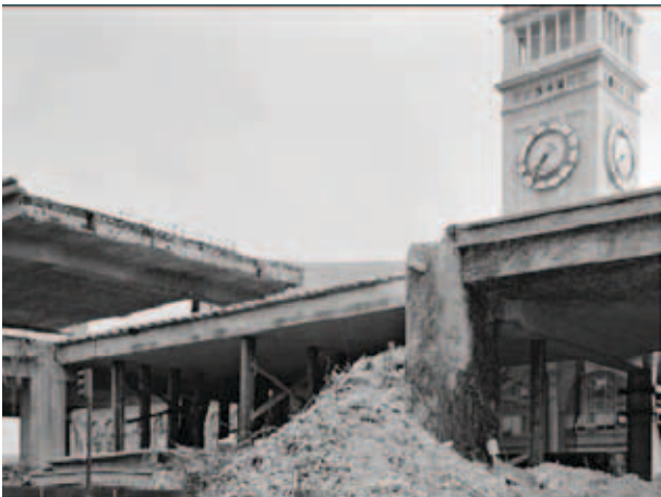
A földrengésben megrongálódott Embarcadero magasút éppen a Ferry Building előtt

1989-ben földrengés rázta meg San Franciscót, megrongálva az ötvenes években az öböl partjára épített magas vezetésű főutat, az Embarcadero Freewayt is. Nem javították ki, inkább lebontották, visszaadva a környéknek a tengeri kapcsolatot és parkokat építve a magasút egy része helyére. Az új körúton, végig a tengerparton már van kerékpárút, széles járda, ahol korzózni lehet és föllendült a kereskedelem. A témát alaposan körüljárva mutatja be a változást Clarence Eckerson Jr. filmje , melyet 2006-ban forgatott a New York City Streets Renaissance kampány és az Open Planning projekt keretében.