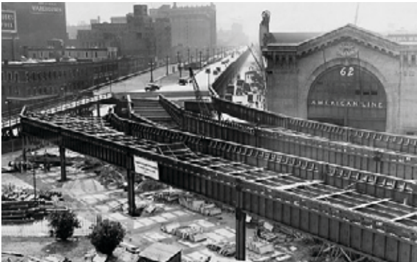
A West Side Highway New-Yorkban

1920-ban kezdődött New-Yorkban az első magasút, a West Side Highway építése.