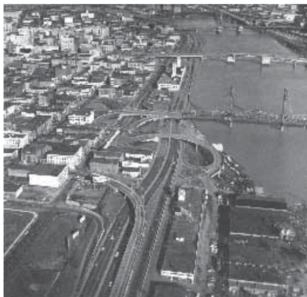
Az 1942-ben befejezett Harbor Drive (Portland, Oregon) 1964 körül