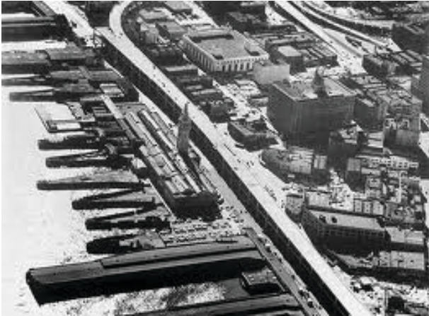
A magasút 1950-ben, (San Francisco History Center, San Francisco Public Library)