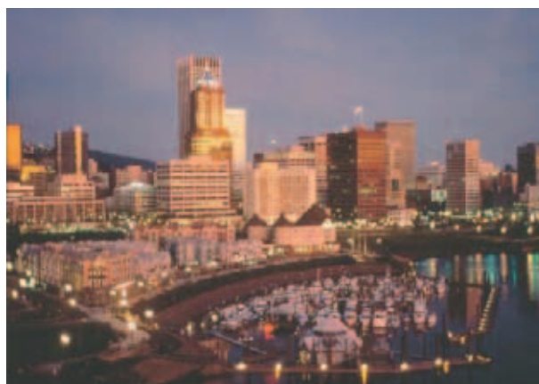
A folyópart ma Portlandban, mögötte a belváros