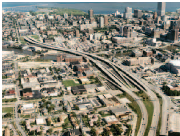
A Park East Freeway Milwaukee-ban (Wisconsin) a Milwaukee folyó fölött (lebontották 2002-2003-ban)

1968-ban a város még megvásárolta a Journal Buildinget (fent, középen, a két híd között), hogy lebontsa és a helyén kibővítsa a városi autópályát. Az 1969-ben „Folyópart az emberért” néven indult civil mozgalom elérte, hogy az állam kormányzója elrendeljen egy lakossági meghallgatást a Harbor Drive jövőjéről, amire a közlekedéstervezők három