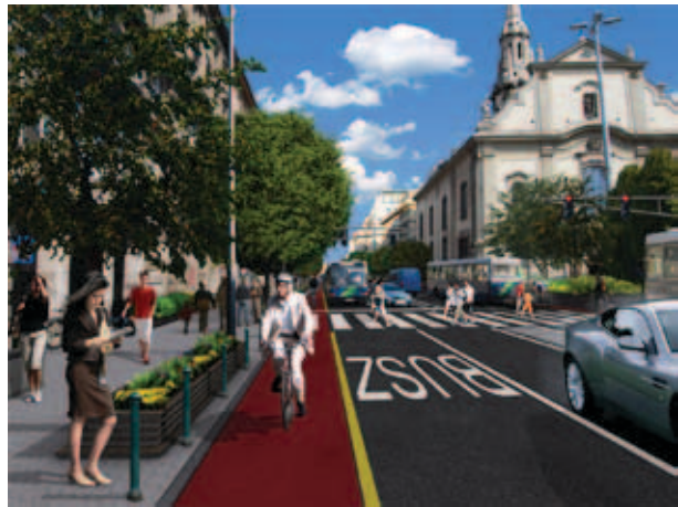
Lehetne ilyen is a Kossuth Lajos utca, ha a politikusok észrevennék, merre halad a világ

Nem halt ki a város, nem lassult a növekedés, köszönik, jól vannak. Miközben Budapesten fővárosi és kerületi önkormányzati vezetők versenyt aggódnak azon, hogy megeszik őket az autósok, ha a Levegő Munkacsoport, a VEKE és még számos civil szervezet, sőt sok közlekedéstervező unszolásának engedve, a Kossuth Lajos utcában és a Rákóczi úton csak kétszer egy sávot hagynak meg az autóknak, kétszer egy sávot egy közös villamos- vagy buszsávnak, és az így nyert területen kerékpárutat és zöldsávot alakítanak ki. Pedig nemcsak Dél-Koreában, hanem a világ más vidékein is, Budapestnél jóval nagyobb városokban már számoltak föl sikerrel soksávós átmenő utakat, és építettek helyettük inkább sétálóutcat vagy parkot. Még több helyen gondolkoznak hasonló változtatáson.