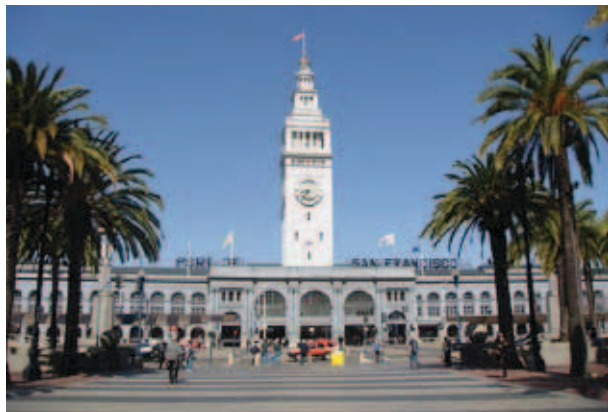
A Ferry Building előtti tér és a szintbeli út napjainkban