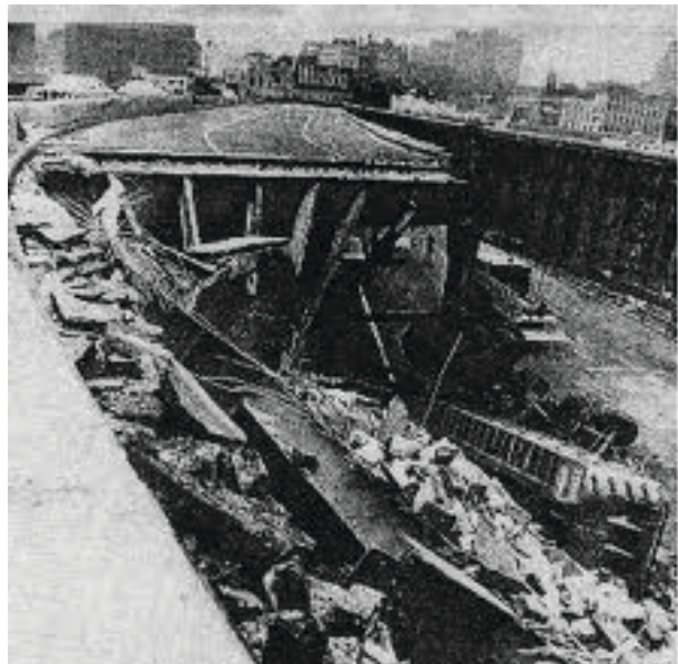
1973: A West Side Highway leszakadt a Gansevoort Streetnél

Ötven évvel később, 1973-ban már annyira elhasználódott volt, hogy le kellett zárni a forgalom elől. A lezárás után a korábban ezen az úton zajló forgalom 53 százaléka egyszerűen eltűnt, ami ékes bizonyítéka annak, hogy az útkapacitások csökkentésével lehet a forgalmat is csökkenteni.