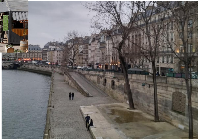
A párizsi Szajna-part napjainkban 4