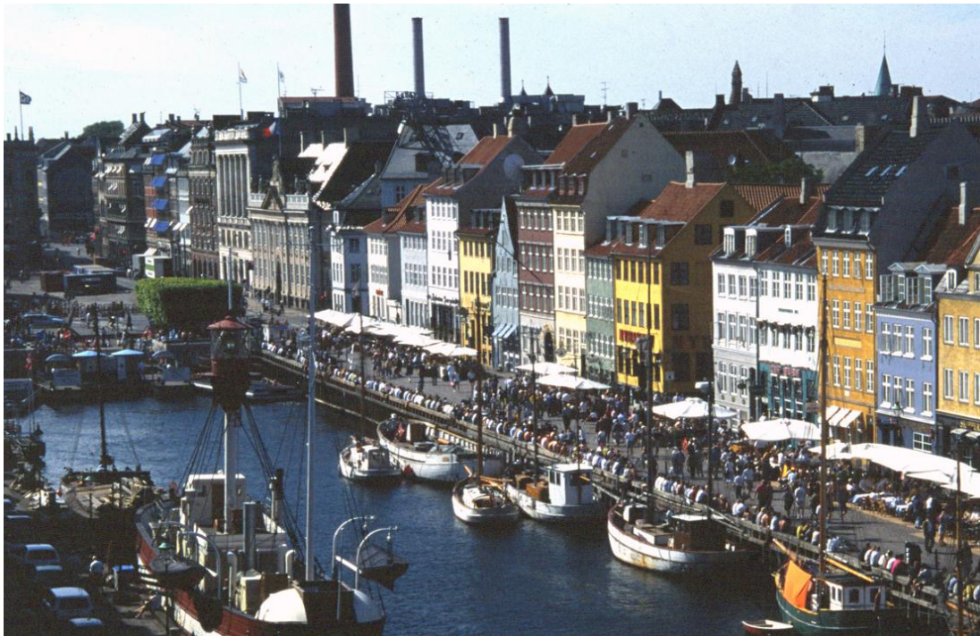
A koppenhágai Nyhavn kikötő a 2000-es években 7