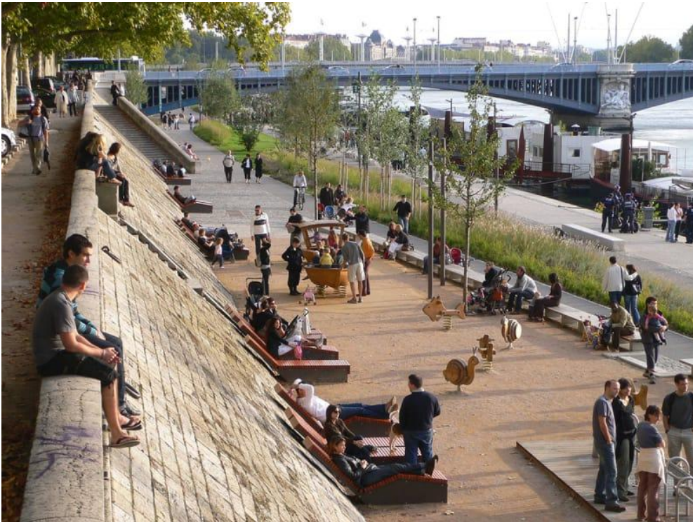
Lyon rakpartja 2014-ben 6

no%2F!7i4160!8i2340!4m5!3m4!1s0x47c671dfbd14de23:0xb946d5c495713087!8m2!3d48.8548346!4d2.3421504