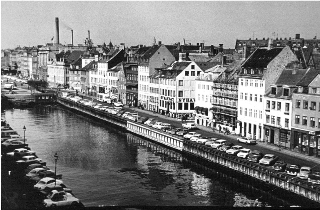
A koppenhágai Nyhavn kikötő az 1980-as években

Koppenhágában a városközpontban lévő Nyhavn kikötőből tüntették el a parkoló autókat, és azóta tömegek járnak oda kikapcsolódni, a helyi vendéglátósok pedig vagyont keresnek.