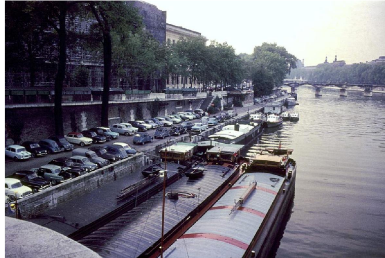
A párizsi Szajna-part a korábbi évtizedekben 3