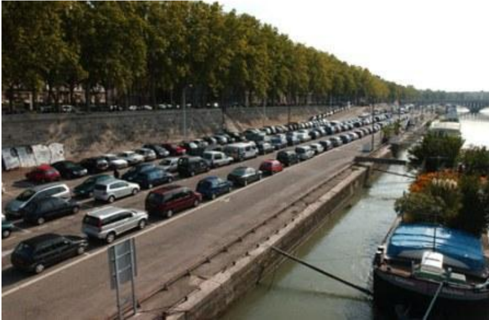
Lyon rakpartja a 2000-es évek elején 5

A harmadik legnagyobb francia várost, Lyont kettészélő Rhône folyó bal partját 5 kilométer hosszan 2007 tavaszán adták át teljes egészében a városlakóknak. A rakparton a parkoló autók helyén sétányt és bicikliutat létesítettek, mellettük természetes növényzet, botanikus kertek, játszótérek és éttermek, pihenőhelyek váltják egymást, összesen 10 hektáros területen.