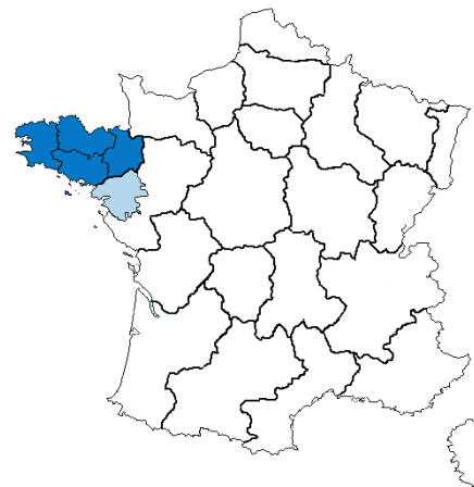
Bretagne régió régió és Loire-Atlantique megye térképe